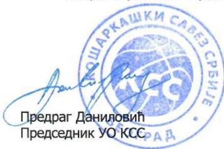
Предраг Даниловић Председник УО КСС