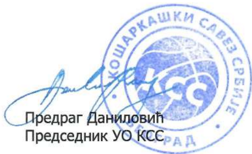
Предраг Даниловић Председник УО КСС